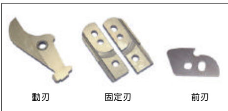
動刃 固定刃 前刃