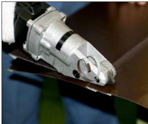
横葺成型材の切断