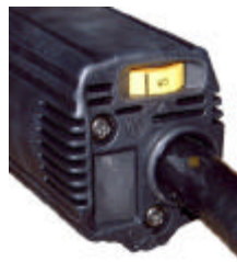
速度設定ダイヤル