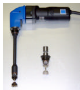
オプション品のツールホルダー・ショータイプが取り付け可能