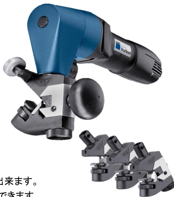
角度別ブラケット