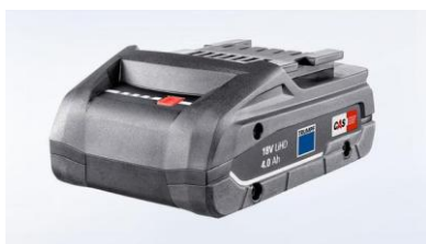
電池 18V LiHD 4Ah