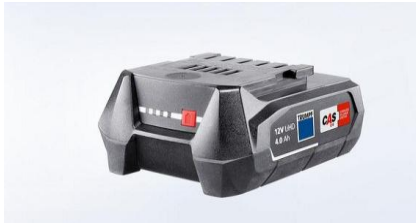
電池 18V LiHD 4Ah