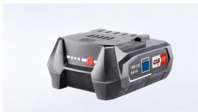
電池 12V LiHD 4Ah