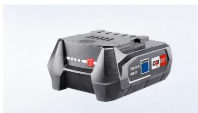
電池 12V LiHD 4Ah