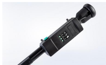
ハンドル部電子ボックス